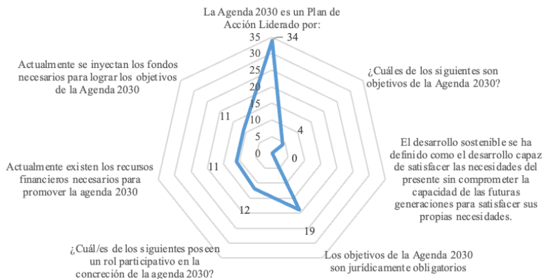
FIGURA 2: ANÁLISIS POR OBJETIVOS SELECCIONADOS POR LOS ESTUDIANTES SOBRE LOS ODS DE LA ONU (N=91).